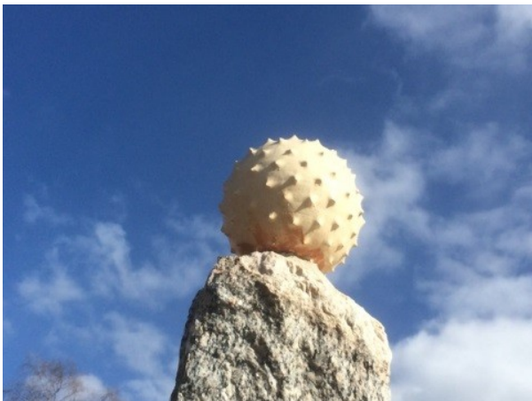
Ökenpärlan i Frälsarkransparken vid stiftsgården i Undersvik

Pilgrimens nyckelord: Bekymmerslöshet, långsamhet, tystnad, andlighet, frihet, enkelhet och delande.