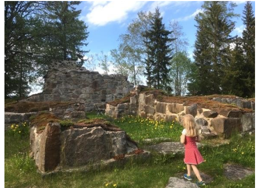
Kyrkoruinen i Skog

Leden fortsätter efter kyrkoruinen först en bit längs med 83:an och vägen genom Strand och sedan över riksvägen igen för att följa skogsbilvägen ända fram till Knupbodarna, en fäbodvall med anor från sent 1600-tal.